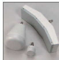
Universal-Muldenstrahler Rundfeldstrahler Kleinfeldstrahler

■ Drei Strahlergrößen , leicht austauschbar. Universal-Muldenstrahler für mittlere und große Behandlungsbereiche. Rundfeldstrahler für lokal begrenzte Krankheitsprozesse. Kleinfeldstrahler für kleine Bereiche und HNO-Anwendungen.