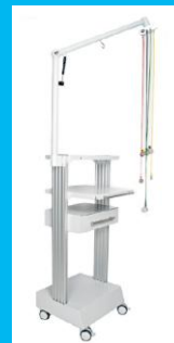
Applicard 2.0 Sauganlage mit Gerätewagen MW-1250