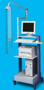
Applicard 2.0 Sauganlage mit Gerätewagen PPC-1330