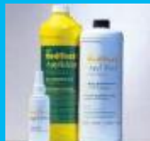
Applicard Kontaktflüssigkeit Applicablean Reinigungsflüssigkeit

Das Applicard 2.0 Elektroden-Sauganlagen Montagemodell kann an verschiedene Gerätewägen montiert werden. Des Weiteren gibt es eine Tisch- und Wandhalterung.