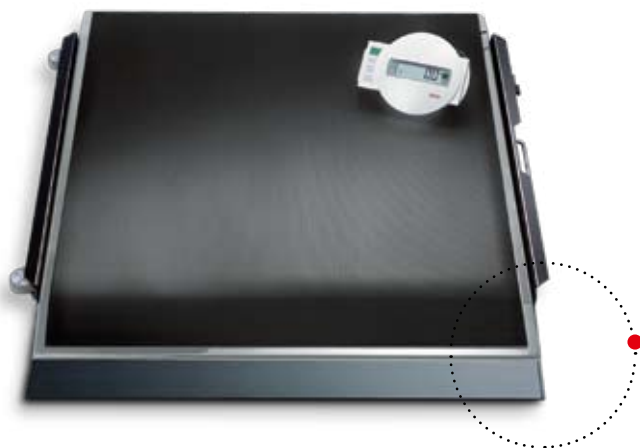
Im Lieferumfang ist eine Rampe zum leichten Auffahren von Rollstühlen enthalten.