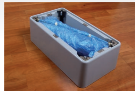
Abb. 3: Hängen Sie dann die diagonal gegenüberliegende Seite ein (siehe Abb.) und danach die beiden übrigen Seiten. Sollten sich noch Einmalschuhe eines vorherigen Stapels im Dispenser befinden, drücken Sie die Kunststoff- clips beider Stapel fest zusammen. Streichen Sie nun die Einmalschuhe mit den Händen gleichmäßig aus.

Abb. 2: Vergewissern Sie sich, dass der Einmalschuh-Nachfüllstapel vor dem Einsetzen korrekt ausgerichtet ist (Länge - Breite). Die offene Seite muss nach oben zeigen. Setzen Sie nun einen Stapel der Kunststoff-Clips in die entsprechen- de Aufnahme ein (siehe Abb.).