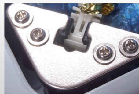
Abb. 5: Wenn alle Ecken befestigt sind, prüfen Sie bitte, ob die oberen Clips in allen vier Ecken einen Abstand von 1 mm zur Oberfläche einhalten. Falls nicht, ziehen Sie den Clip-Stapel bitte mit der Hand bis auf 1 mm Abstand nach oben.

Abb. 4: Öffnen Sie nun den Bindedraht an den Ecken des Einmalschuh-Stapels.