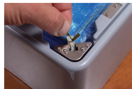
Abb. 4: Öffnen Sie nun den Bindedraht an den Ecken des Einmalschuh-Stapels.

Abb. 3: Hängen Sie dann die diagonal gegenüberliegende Seite ein (siehe Abb.) und danach die beiden übrigen Seiten. Sollten sich noch Einmalschuhe eines vorherigen Stapels im Dispenser befinden, drücken Sie die Kunststoff- clips beider Stapel fest zusammen. Streichen Sie nun die Einmalschuhe mit den Händen gleichmäßig aus.