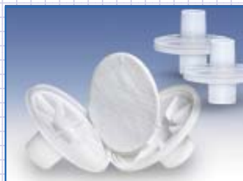
Patientenschutz: Bakterien-/Virenfilter mit Filtergehäuse.