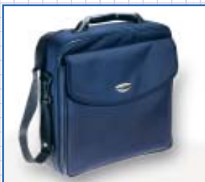
Mobil: Gerätetasche mit Handgriff und Schultergurt.

PC-Software: für Echtzeit-Spirometrie am Computer oder Daten-Download (gehört zum Standard-Lieferumfang)