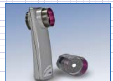
Leichtgewicht: MiniFlowMeter mit einem Gewicht von nur 65 g.