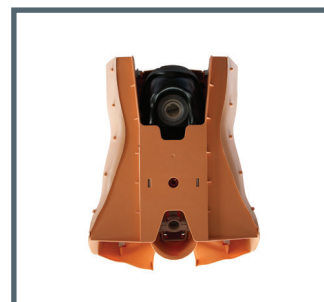
Kompakte Lagerung - Kopf im Torso der Puppe