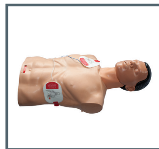
Platzierung der AED-Pads

Ambu A/S Baltorpbakken 13 DK - 2750 Ballerup Denmark Tel. +45 7225 2000 Fax +45 7225 2053 www.ambu.com