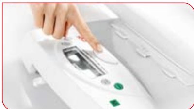
Mit nur einem Tastendruck lässt sich die Wiegemulde schnell und leicht ablösen.

Ein Handgriff genügt, um die Säuglingswaage in eine Flachwaage zu verwandeln: Durch Drücken einer Taste löst sich die Verbindung zwischen der Wiegemulde und dem Untergestell. Die feste Verbindung zwischen Mulde und Untergestell im arretierten Zustand ermöglicht das problemlose Anheben und den sicheren Transport der Säuglingswaage.