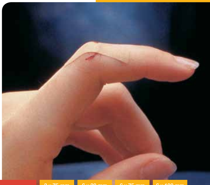
3M™ Steri-Strip™ Elastic