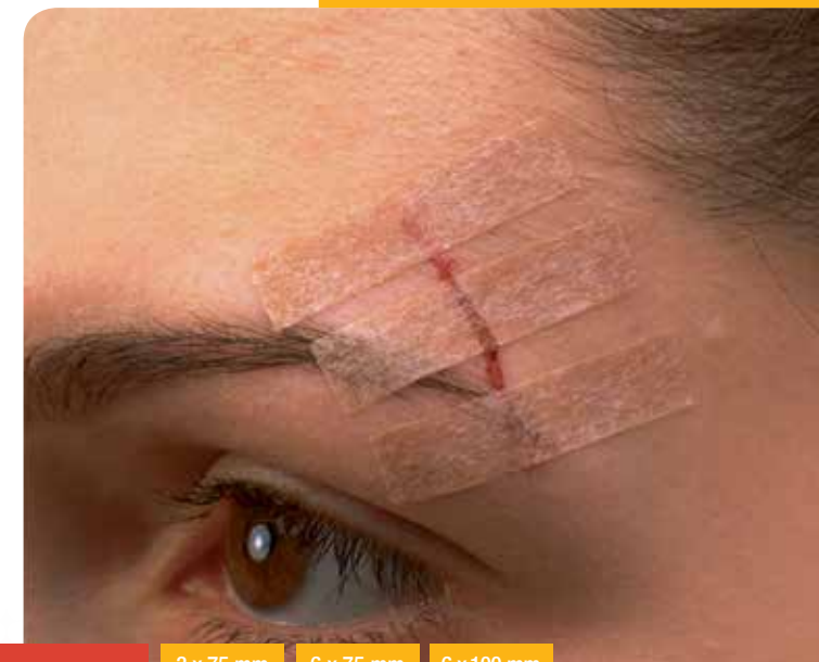
Muster: B 1551