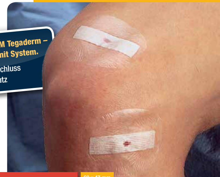
3M™ Steri-Strip™ Wundverschlussystem

3M Steri-Strip und 3M Tegaderm – die Komplettlösung mit System. + optimaler Wundverschluss + perfekter Wundschutz