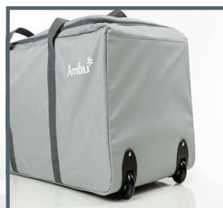
AmbuMan Basic 4er Set 2 x Tragetasche mit Rollen (für je zwei AmbuMan Basic)