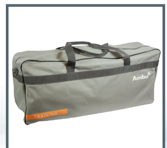
Tragetasche AmbuMan Basic

Ambu A/S Baltorpbakken 13 DK - 2750 Ballerup Denmark Tel. +45 7225 2000 Fax +45 7225 2053 www.ambu.com