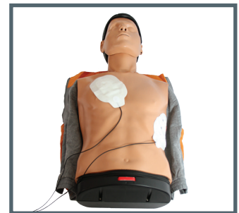
Platzierung der Defibrillationselektroden