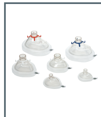
Ambu Einweg-Gesichtsmaske PLUS mit Cufffüllventil