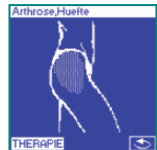
Grafik zum Behandlungsgebiet