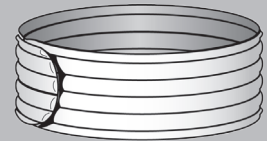
Art./REF 2050 Hals-Kopf-Schal

Artikel nur für den bestimmungsgemäßen Gebrauch verwenden!