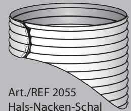
Art./REF 2055 Hals-Nacken-Schal