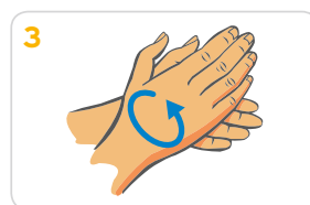
3 Handflächen aneinander reiben, bis sich Schaum bildet. Danach die Hände gründlich waschen.