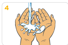
4 Hände mit Wasser abspülen.