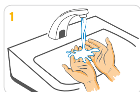
1 Hände mit Wasser anfeuchten.