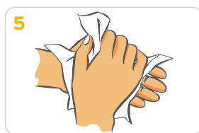
5 Hände gründlich mit einem Wegwerfhandtuch abtrocknen.