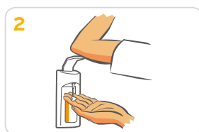
2 1-2 Pumpstöße auf eine Handfläche geben.