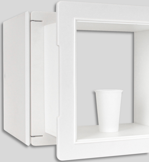
Integrierte Bänder, Türgriffe und Magnetverschluss