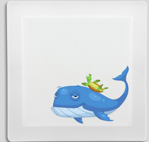
Designbeispiel für die Kinderarztpraxis

Die fugenlose Verarbeitung aus HI-MACS® Mineralwerkstoff und Acryl sind Garant für hygienische Oberflächen. Die Einfachheit der Handhabung | kein Griff, integrierte Türbänder und der clevere Magnetverschluss | spiegelt sich in der gesamten Konstruktion und dem abgerundeten Design der Durchreiche wider.