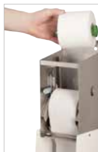
WC-Papierspender zum Nachfüllen geöffnet

Passende Haushaltsrollen finden Sie in unserem aktuellen Katalog mit den derzeit gültigen Preisen sowie auf unserer Homepage www.air-wolf.de