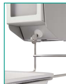
Abschließbare Verschlussblende gegen Diebstahl