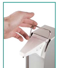
Notbedienhebel zur mechanischen Bedienung des Spenders bei Funktionsstörung