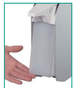
Zur Reinigung entnehmbarer Innenbehälter