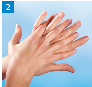
Schritt 2 Rechte Handfläche über linkem Handrücken und linke Handfläche über rechtem Handrücken.