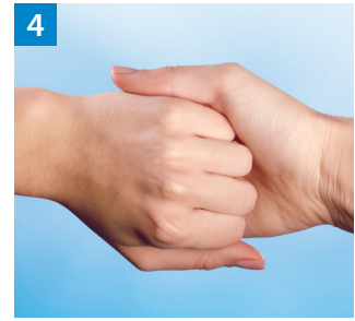
Schritt 4 Außenseite der Finger auf gegenüberliegende Handflächen mit verschränkten Fingern.