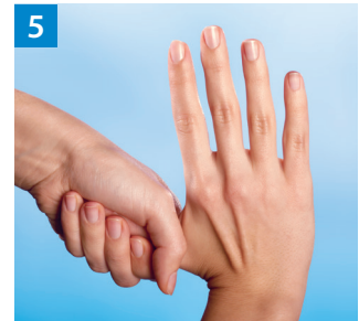
Schritt 5 Kreisendes Reiben des rechten Daumens in der geschlossenen linken Handfläche und umgekehrt.