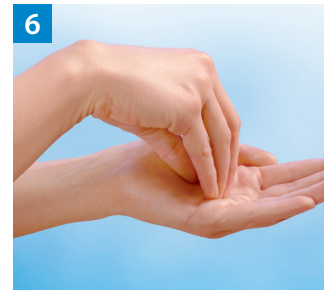
Schritt 6 Kreisendes Reiben hin und her mit geschlossenen Fingern der rechten Hand in der linken Handfläche und umgekehrt.