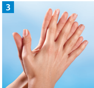
Schritt 3 Handfläche auf Handfläche mit verschränkten, gespreizten Fingern.