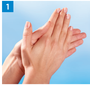
Schritt 1 Handfläche auf Handfläche.