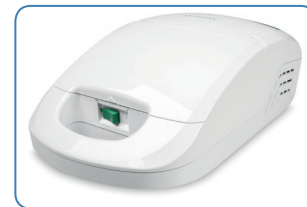
kompakt und transportabel