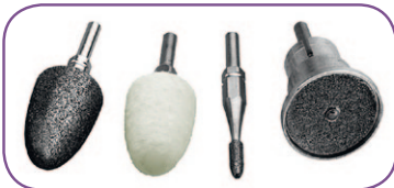
3 Aufsätze aus Saphir für alle Anwendungen und 1 Filz-Polierkegel