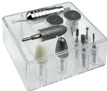
9 Aufsätze aus Saphir für alle Anwendungen und 1 Filz-Polierkegel