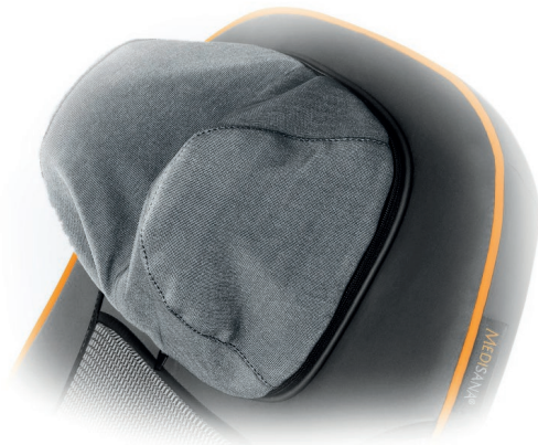
Mit abnehmbarem und waschbarem Nackenbezug