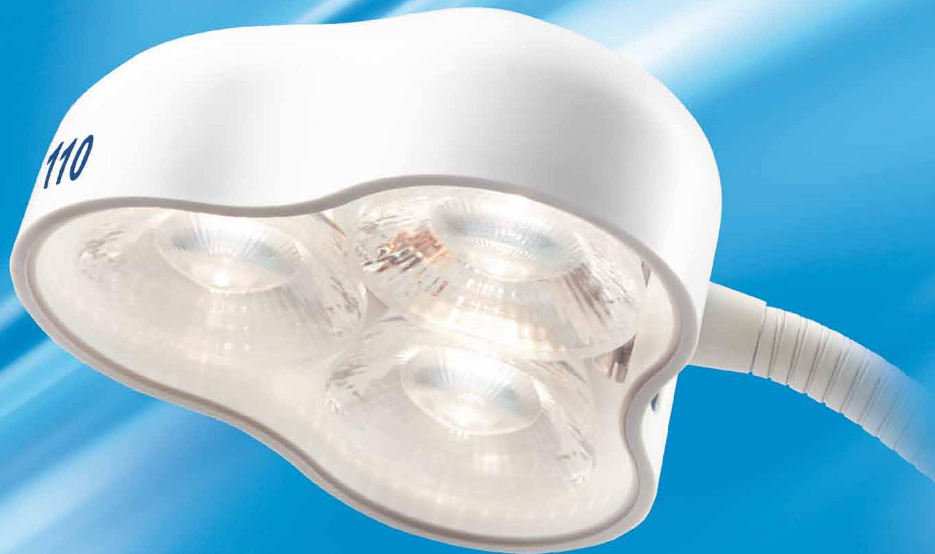
Mach LED 110 30.000 Lux (0,5 m Abstand)

Kompakte Untersuchungsleuchte mit LED-Technologie für Diagnose und Prophylaxe