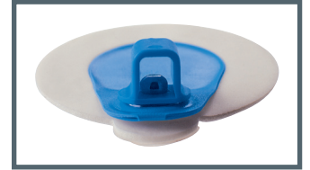
A = 4 mm Bananenstecker