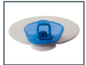
A = 4 mm Bananenstecker