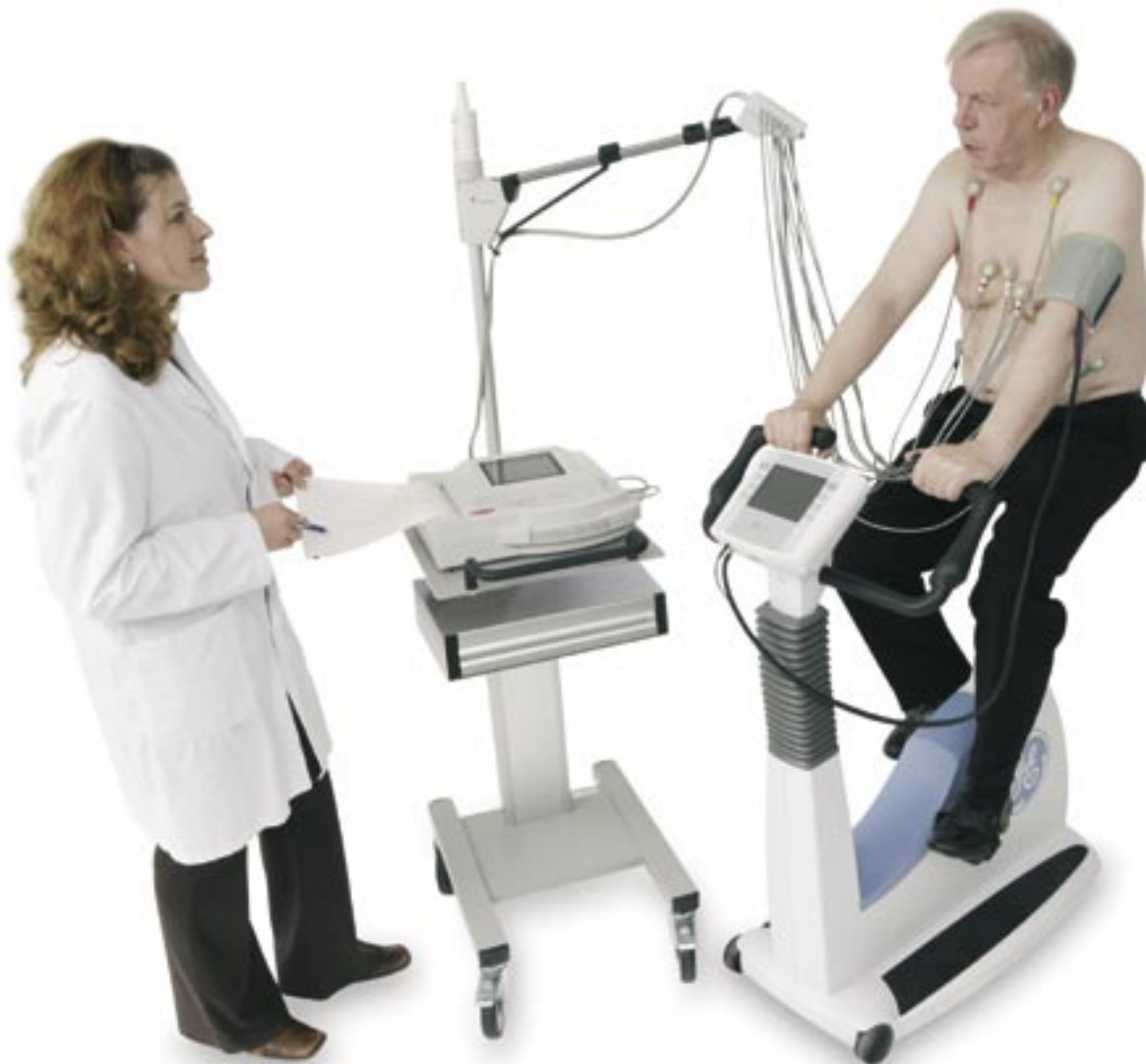
MAC 1200 ST dem Elektroden-Applikationssystem KISS und eBike comfort PC plus