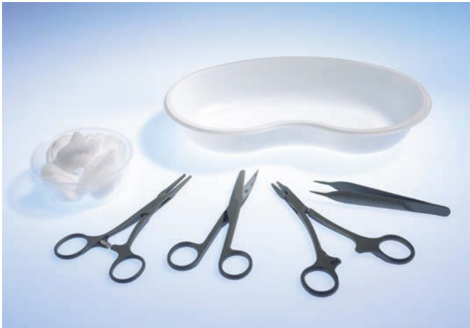
5061000 Naht-Set 1