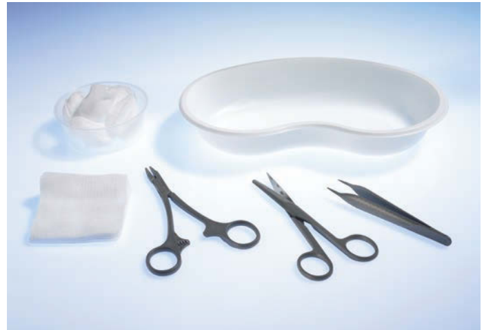
5061010 Wundversorgungs-Set 1