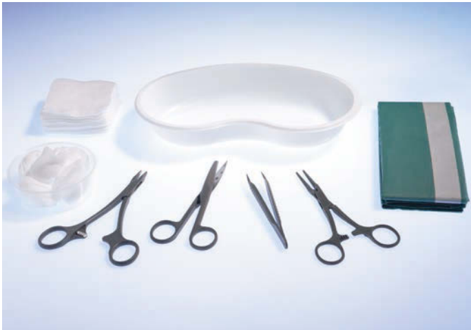
5061020 Wundversorgungs-Set 2