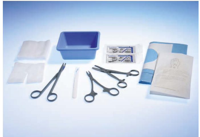
5062000 Thorax Drainage-Set, klein