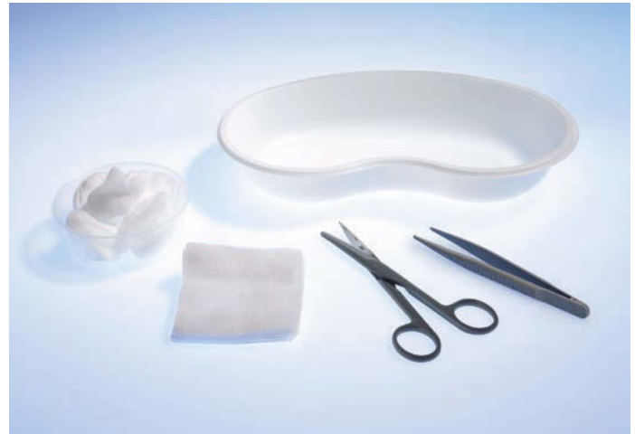
5061030 Wundversorgungs-Set 3