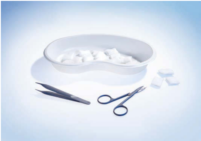
5061040 Fadenzieh-Set 1