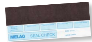
MELAG seal check

Für die periodische Überprüfung der Funktion der MELAseal® Pro bietet MELAG eine Siegelnahtfestigkeitsprüfung an.