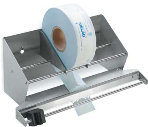
MELAseal® Pro Rollenhalter mit Schneidevorrichtung

Mit dem eingebauten Schneidmesser wird die Folie auf die gewünschte Länge sauber und schnell abgeschnitten.