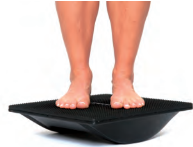
Diagonale Ebene (Füße schräg zur Kipprichtung)

Der Kipp-/Beugewinkel des Kreisels liegt bei 22°, der des Kippbretts bei 30°