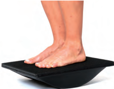
Sagittalebene (Füße in Kipprichtung)