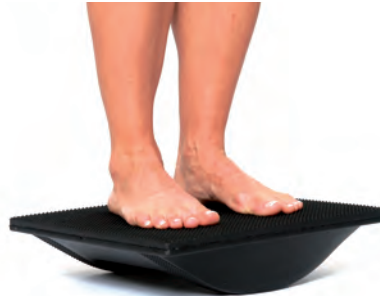
Frontalebene (Füße parallel zur Kipprichtung)