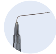
Ambix Safe-Can® 90 Grad gebogen