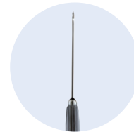
Ambix Safe-Can® Gerade