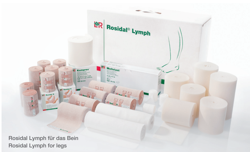
Rosidal Lymph für das Bein Rosidal Lymph for legs

Mit Rosidal Lymph erweitert L&R sein Konzept für die lymphologische Kompressionsbehandlung. Sinnvoll aufeinander abgestimmte Komponenten werden Sie durch ihre therapeutische Wirksamkeit und ihren Komfort überzeugen.